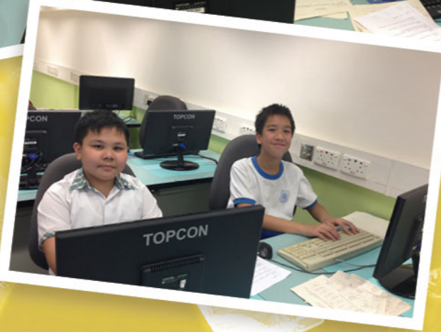
文書處理組的同學替我們處理大量文字輸入工作，他們都是我們的小天使！