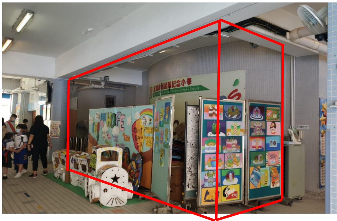
地下有蓋操場：新做牆身連加固工程位置