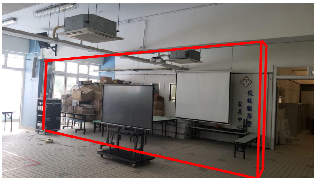
1/F 平台：新做牆身連加固工程位置